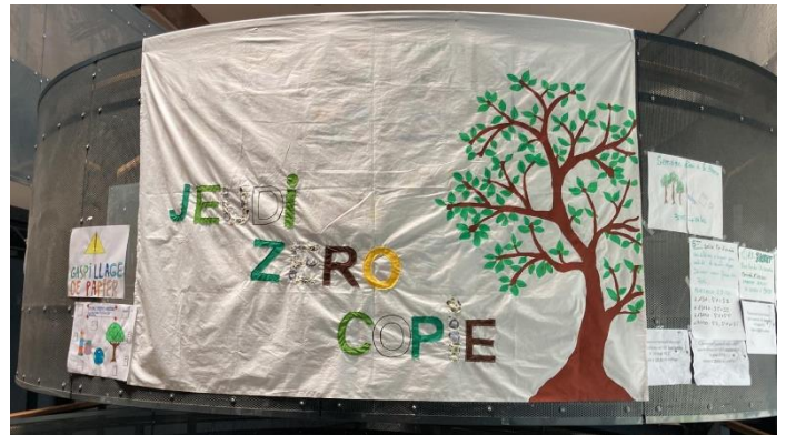
Figure 1 : banderole du collège J. Michelet

Afin de sensibiliser les enseignants et les élèves à la quantité de papier utilisé (et jeté), il est intéressant de mettre en place un challenge zéro papier : sur un temps donné, les enseignements doivent être limités en utilisation de papier.